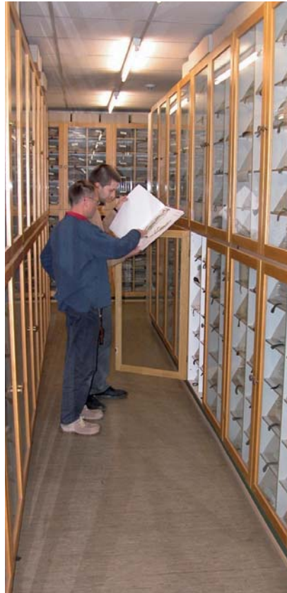
Abb. 1 Das Herbarium Senckenbergianum (FR) ist mit über 1 Mio. Belegen das fünfgrößte Deutschlands. Es ist im Arthur von Weinberg-Haus in der Kuhwaldstraße 55 in Frankfurt/Main untergebracht.

Insgesamt sind 11 166 Belege in der Datenbank mit dem geographischen Schwerpunkt