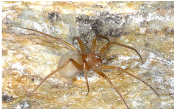
Abb. 1: Zimiris doriai Simon, 1882, eingeschlepptes Weibchen, Köln. Beachte die nach vorne verlagerten lateralen vorderen Spinnwarzen und die drei hell scheinenden Nebenaugen.

Verbreitung: Nach PLATNICK & PENNEY (2004) ist die Art in Indien, Indonesien (Java), Malaysia, Elfenbeinküste, Sudan, Jemen, Eritrea, Französisch-Guyana, Kuba, Mexiko und in der Dominikanischen Republik verbreitet. Der Container, aus dem die eingeschleppten Tiere stammen, kam aus Vietnam, d.h. er war dort beladen worden. Es ist