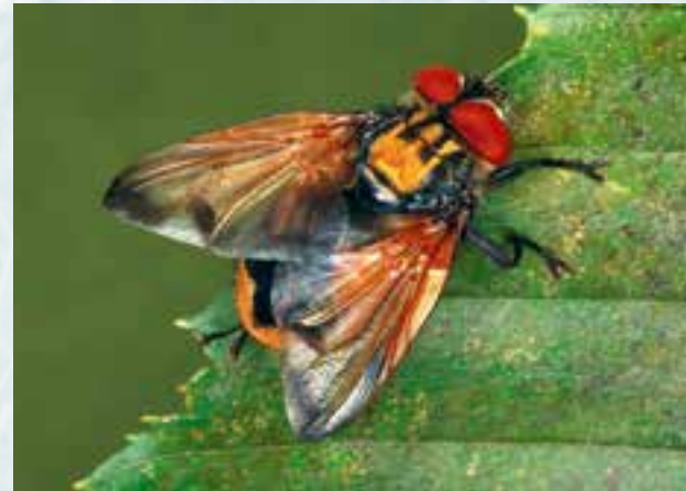
Männliches Exemplar von Phasia aurigera in typischer Sitzhaltung. Die namensgebende kronenähnliche Rückenzeichnung ist deutlich zu erkennen. Ihr goldfarben umrandetes violettblaues Abdomen ist dagegen nur zu sehen, wenn die Fliege ihre Flügel spreizt.

Phasia aurigera ist eine auffällige Fliege und mit 8–12 mm Körperlänge relativ groß. Sie wurde 1860 aus der Umgebung von Wien erstmals von Johann Georg Egger beschrieben. Die Männchen besitzen gefleckte Flügel und eine goldfarbene Zeichnung auf dem Schild (= Rücken) was ihr den Namen Goldschildfliege eingebracht hat. Die Weibchen sind unscheinbarer mit glashellen Flügeln und einfarbig dunklem Körper. Dieses sehr unterschiedlich ausgeprägte Erscheinungsbild zwischen männlichen und weiblichen Individuen der gleichen Art wird auch Sexualdimorphismus genannt. Wir kennen dieses Phänomen auch von manch anderen Tieren, wie Erpel und Ente, Hirsch und Hirschkuh. Bei Zweiflüglern ist es aber selten so deutlich ausgeprägt.