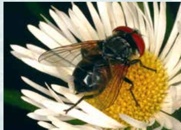
Ein Weibchen von Phasia aurigera bei der Nektaraufnahme an einer Blüte. Seine Färbung und Zeichnung ist sehr zurückhaltend. Die glashellen Flügel lassen an ihrer Spitze den langen 'Stiel' der Flügelzelle erkennen: Ein Kennzeichen der Gattung Phasia .