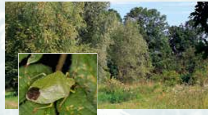
Strukturreiche Waldränder mit blütenreichen Säumen sind der bevorzugte Lebensraum von Phasia aurigera und ihrem Wirt Palomena prasina

Nach der Paarung suchen die Fliegenweibchen nach geeigneten 'Wirten'. Sie durchdringen mit einem speziellen spitzen Legeapparat die feste Hülle der Wanzen und legen ein Ei in deren Körper. Die daraus schlüpfende Fliegenlarve lebt als Innenparasit erst von der Körperflüssigkeit und von Fettzellen, ohne den Wirtsorganismus schwer zu belasten. Später greift sie auch die lebenswichtigen Organe des Wirtes an und tötet ihn dadurch. Auf diese Weise trägt der Parasitoid Phasia aurigera zur biologischen Regulierung von pflanzenschädlichen Wanzen bei. Als Wirte sind vor allem Baumwanzen (Pentatomidae) wie die Graue Gartenwanze ( Rhaphigaster nebulosa ) und die Grüne Stinkwanze ( Palomena prasina ) bekannt. Die fertig entwickelte Fliegenlarve verwandelt sich in einem Puparium zur Puppe. Aus dieser schlüpft die Fliege, die aber nur wenige Wochen lebt. Dennoch kann man die Imagines von Ende Mai bis Ende Oktober beobachten, weil Phasia aurigera zwei Generationen pro Jahr entwickelt. Im Gegensatz zum südlichen Europa sind in Mittel- und Nordeuropa die Fliegen im Frühjahr und Sommer allerdings selten zu finden und eher im September und Anfang Oktober aktiv. Phasia aurigera kommt überwiegend in Waldgebieten vor und ist am häufigsten in angrenzenden Saum- und Offenbiotopen auf Hochstaudenfluren und in Halbtrockenrasen bei der Nektaraufnahme auf unterschiedlichen Blüten zu beobachten.