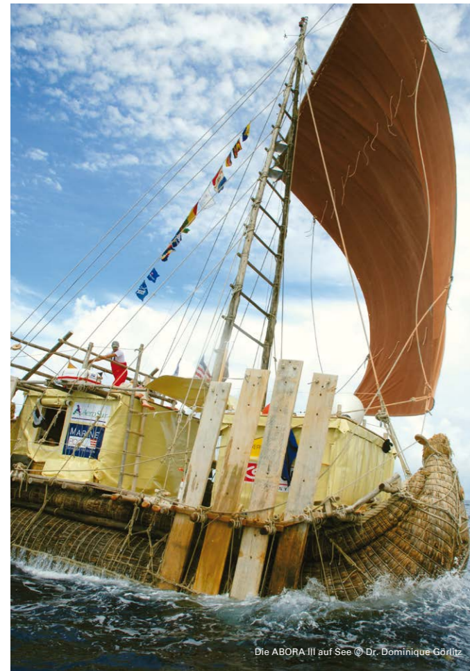
Die ABORA III auf See

Die Ausstellung behandelt neue, experimentelle Ansätze wie die prähistorische Seefahrt, Anthropologie, Vegetationsgeographie, Archäologie, Astronomie, Kartographiegeschichte und Materialforschung. Aktuelle Hinweise aus der interdisziplinären Forschung liefern neuen Zündstoff für die Diskussion um mögliche transatlantische Reisen in der Frühzeit.