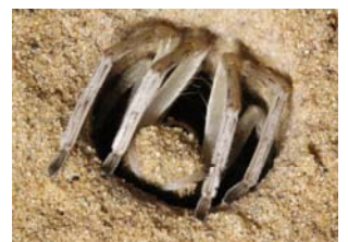
Die Flick-Flack-Spinne Cebrennus rechenbergi in ihrer Behausung