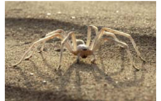
Die Flick-Flack-Spinne Cebrennus rechenbergi

In den Senckenberg-Forschungsinstituten ist die taxonomische und systematische Forschung die stärkste Kernkompetenz. Neue Methoden wie Analysen des Erbgutes lassen sich mit traditionellen Methoden kombinieren und helfen, neue Arten zu identifizieren. „Ziel ist, die Vielfalt des Lebens auf der Erde, die Biodiversität, zu erfassen und zu erhalten“, erklärt Dr. Peter Jäger.