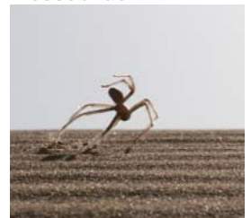
Die Flick-Flack-Spinne Cebrennus rechenbergi in Aktion