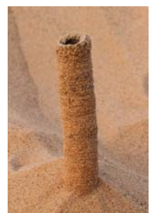
Freigelegt: Röhrenartige Behausung der Flick-Flack-Spinne Cebrennus rechenbergi